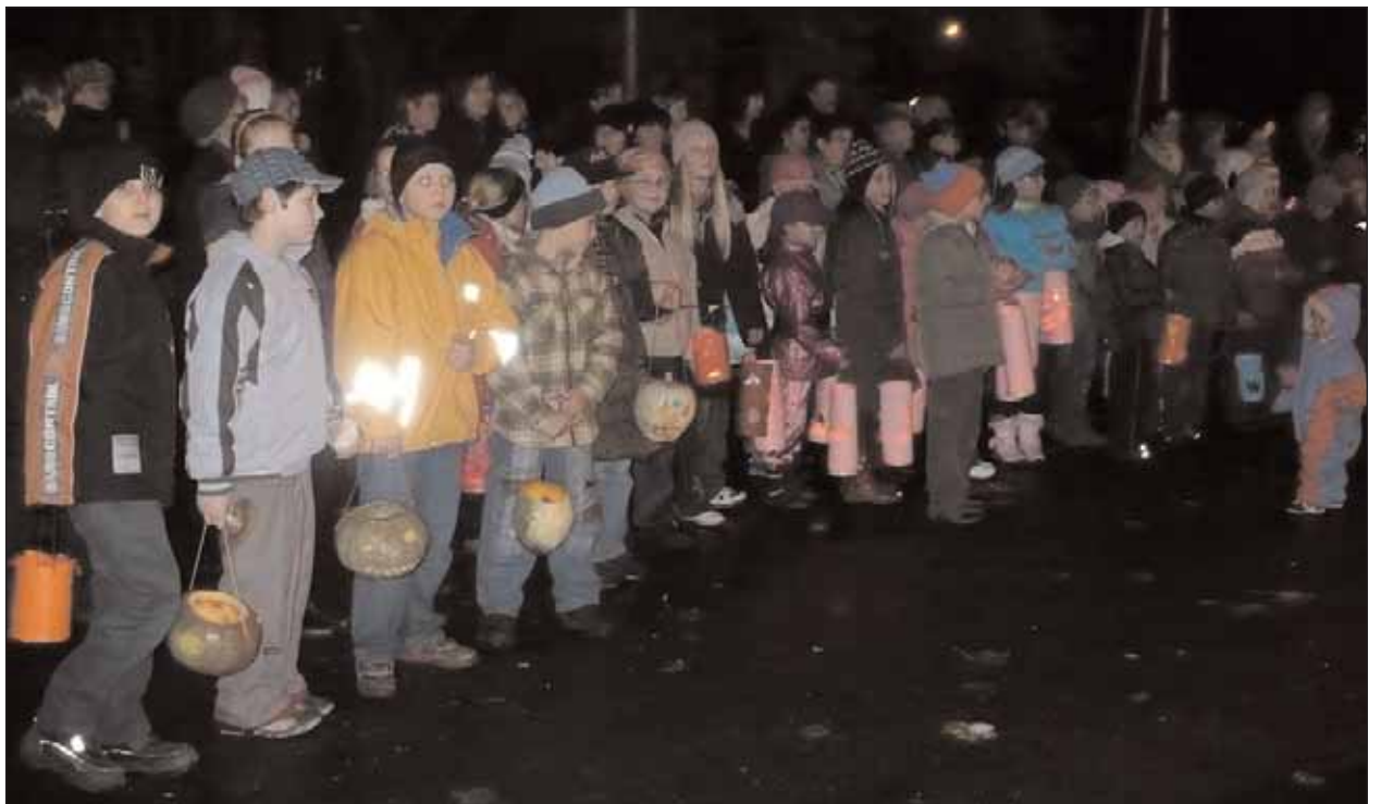
Es gab auch Kürbislaternen