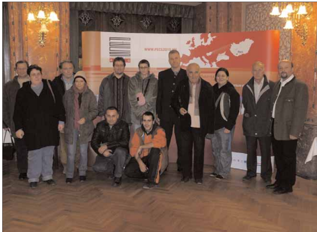
Die Vertreter der Minderheitenorganisationen