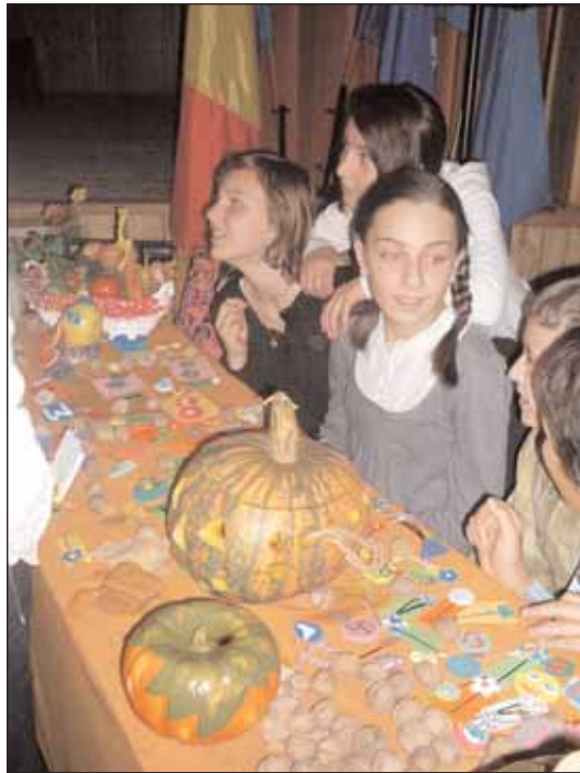
Man konnte allerlei kaufen