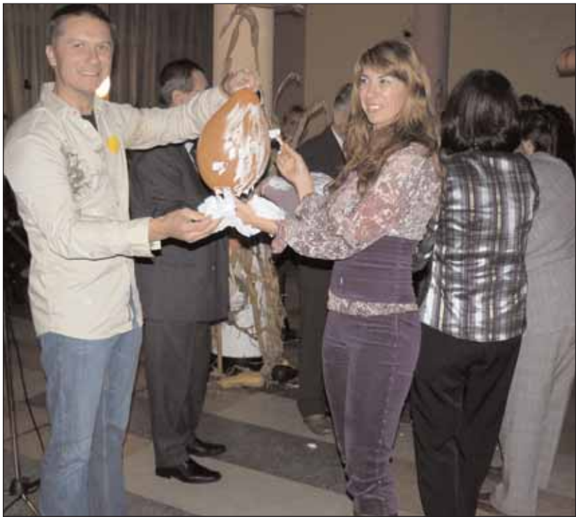
Die Eltern machten bei den Wettbewerben mit

In der mit Kürbislaternen, Teelichtern und Kinderzeichnungen von den Schülern und Lehrern geschmückten Mensa des Johann Ettinger Lyzeums fand am 30. Oktober eine Halloweenparty für die Eltern statt. Die Initiative zur Veranstaltung des Balls stammte von der Schulleitung und dem Elternverein, die für die Renovierung des zweiten Internatsgebäudes im Hof des Lyzeums Finanzierungsmittel sammeln.