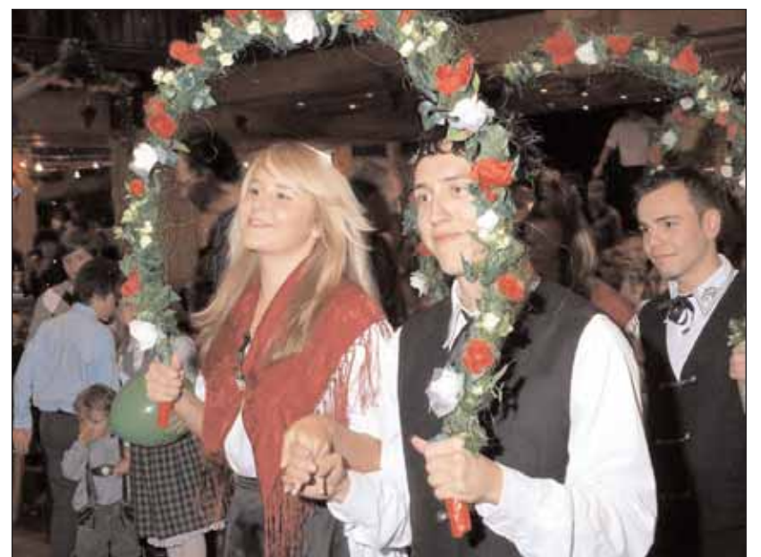
Die Trachtenpaare boten einen schönen Anblick

vor. Am 5. Dezember wird in Lauf "Gloasa", ein seit 1930 von den Schwaben aus Schandern gepflegter Weihnachtsbrauch, wieder belebt.