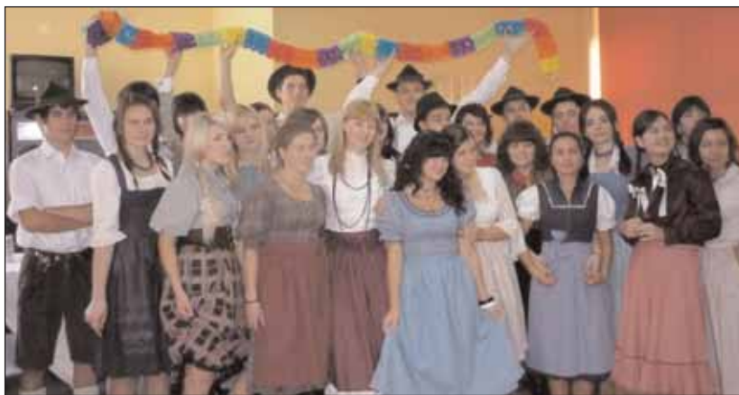
Die Schüler in traditioneller Tracht