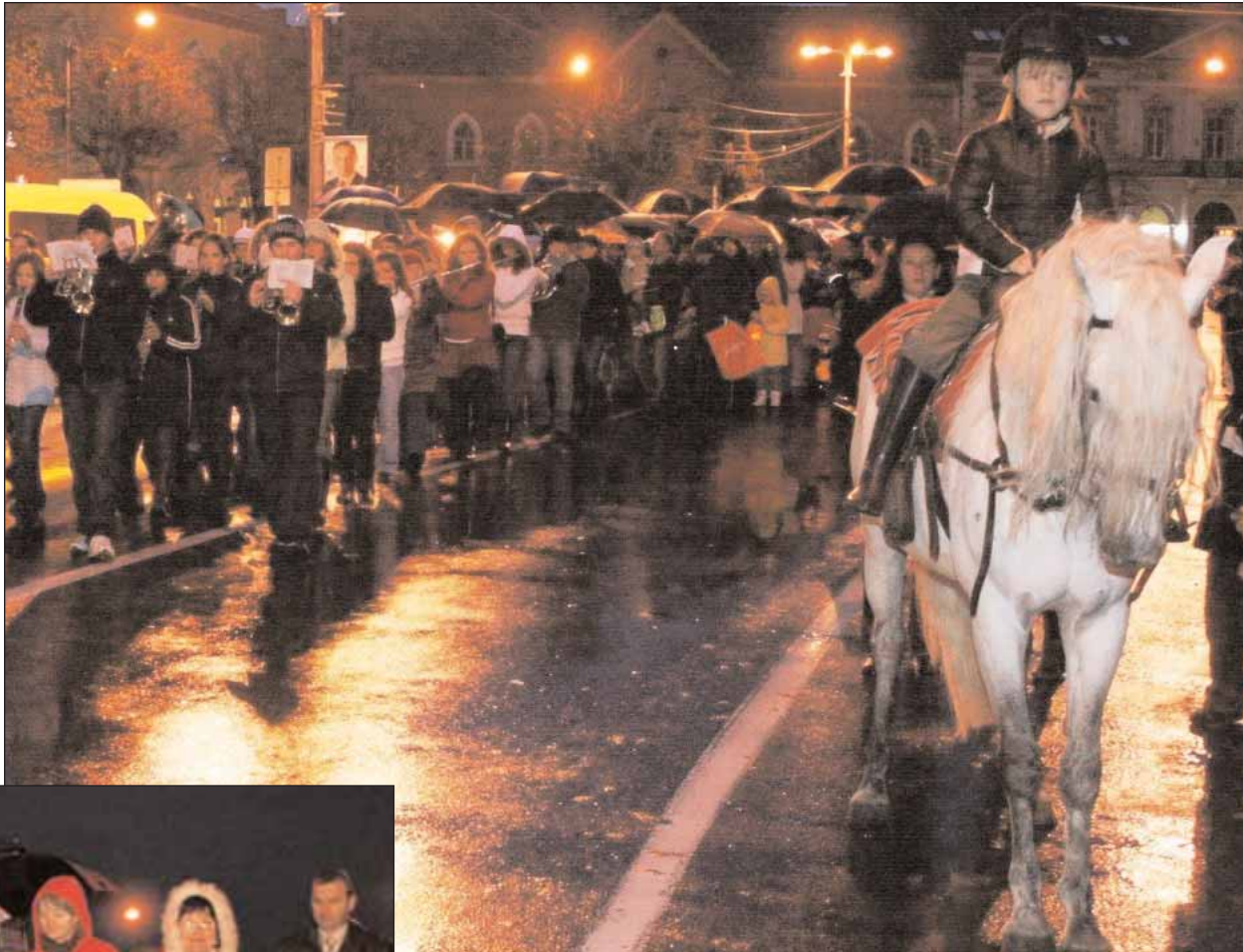
Der Umzug wurde von einem reitenden Kind angeführt

Der junge Martin wurde von einem neunjährigen reitenden Kind dargestellt. Er führte den Martinsumzug an. Ihm folgten die Vereinten Blaskapellen aus Fienen/Foieni, Schamagosch/Ciumești und Schinal/Urziceni und hunderte von Kindergarten- und Grundschulkindern mit ihren Eltern und Lehrern. Diesmal feierten mit den Schülern des Johann-Ettinger-Lyzeums und den Kindern des katholischen Hám-János-Kindergartens auch Schüler der Allgemeinschule Nr. 10 und der Lucian-Blaga-Schule mit.