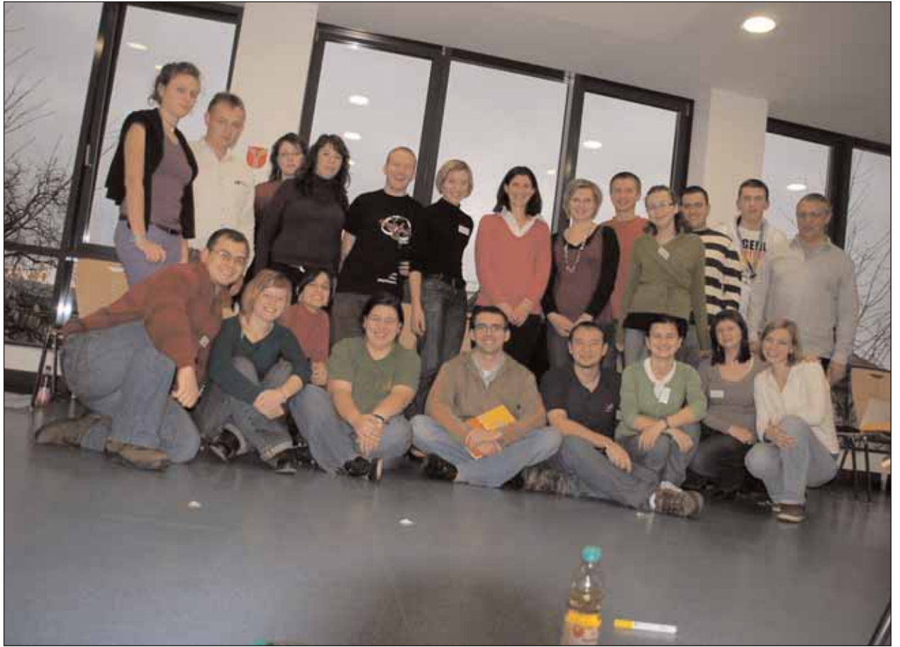
Die Teilnehmer der Tagung in Stuttgart