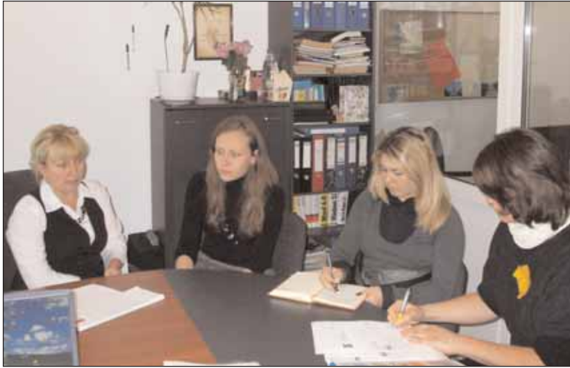
A vendégek és házigazdái a Bajor Házban

Természetesen a szatmárnémetiből érkező látogatókat is szívesen fogadták. Az ifa által kezdeményezett találkozó célja az volt, hogy a Vasile Lucaci utcai közösségi