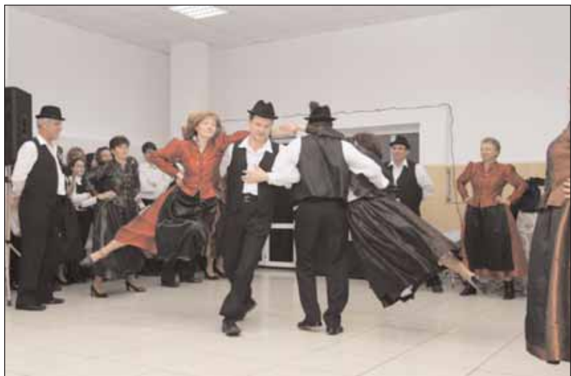
Die Tanzgruppe der Ehepaare