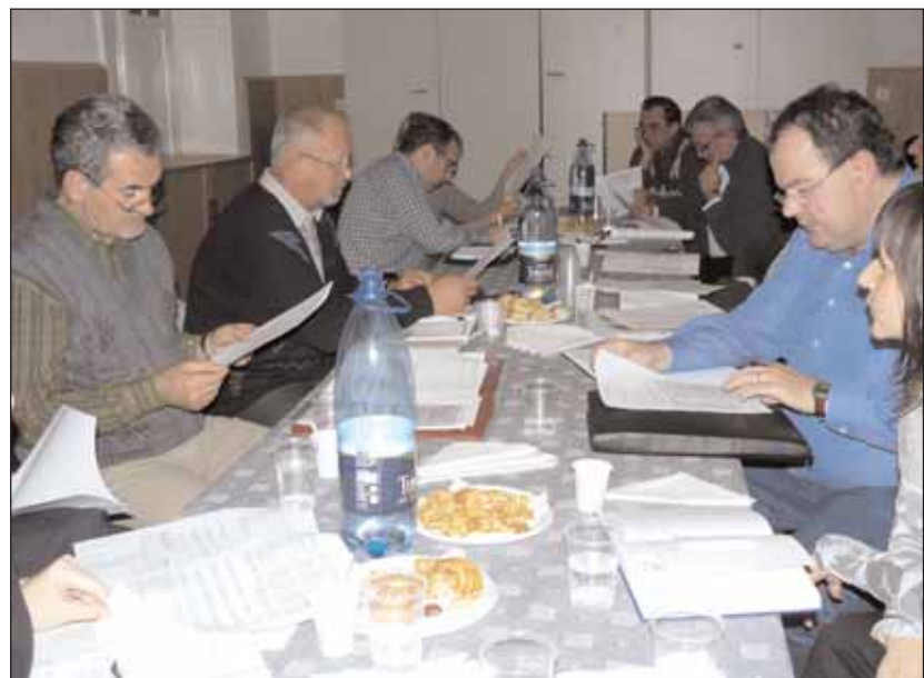
Die Projekte für das Jahr 2010 wurden besprochen