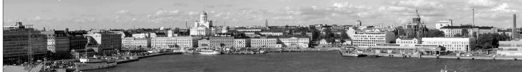
Helsinki, die Hauptstadt Finnlands

Die überaus scheuen Elche sind mit einer Schulterhöhe von über zwei Metern die grössten in Europa lebenden Landsäugetiere. Die zur Familie der Hirsche gehörenden bis zu 800 kg schweren Tiere sind Paarhufer und Wiederkäuer. Charakteristisch für sie ist ihr schaufelartiges Geweih, das eine Spannweite von bis zu zwei Metern haben kann, und das graubraun bis schwarzgraue Fell.