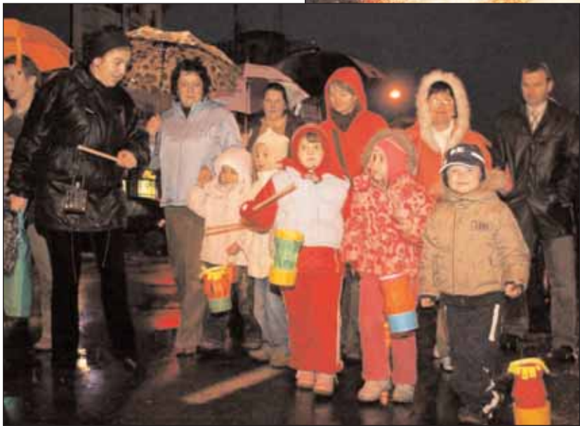
Trotz des Regens hatten die Teilnehmer Spaß