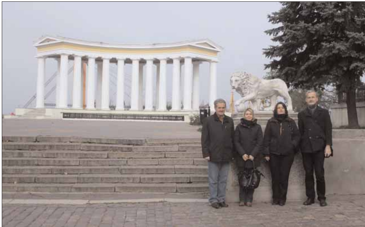
A szatmári küldöttség Odesszában

Ebben az irányban az ukrainai tanulmányút jelentette az első lépést, nemcsak kulturális téren, hanem egy esetleges együttműködés terén is a Szatmári Alapítvány és Iparosok Kamarája, valamint az Ukrán-Bajor Menedzserképző Központ között. Érdeklődéssel várjuk a következő mérföldkövet a szatmárnémeti közösségi ház működésének útján.