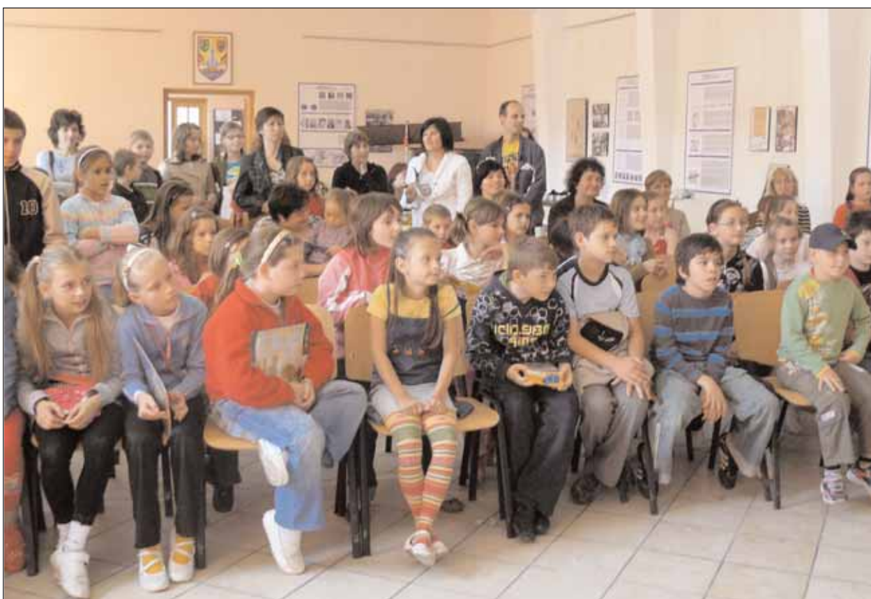
Gyermekünnep az NDF Ifjúsági Központjában