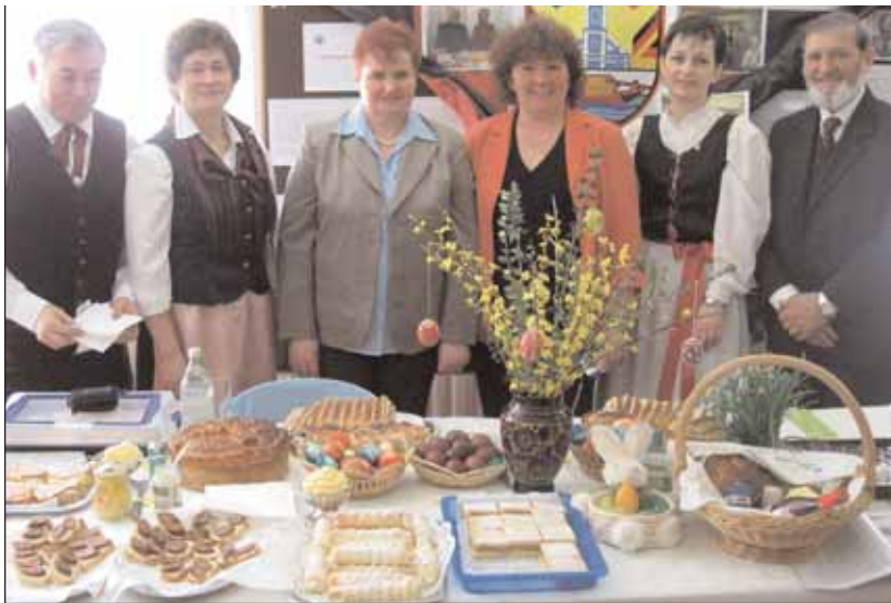
Einen Ostermarkt veranstaltete das Haus der Heimat am 21. März in Stuttgart. Auch heuer überraschten die verschiedenen Vereine, darunter die Landsmannschaft der Sathmarer Schwaben, die Gäste des Ostermarkts mit leckeren Spezialitäten und schönen Osterbräuchen.