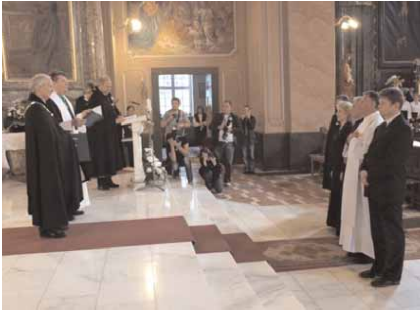
Lovaggá ütési szertartás a Székesegyházban