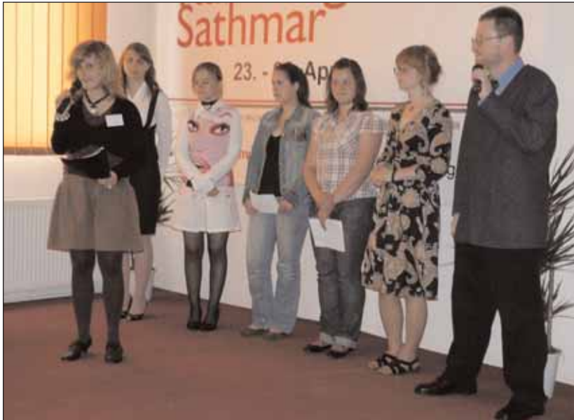
Vorstellung des ifa-Webprojekts: Zeitenwechsel-Seitenwechsel

Im Zeichen des "Zeitenwechsels" stand auch die Präsentation des ifa-Webprojektes "Zeitenwechsel-Seitenwechsel" am 24. April. Jugendliche aus Rumänien und Ungarn hatten im Vorfeld Zeitzeugenberichte zum Thema Wende gesammelt. Ein Teil dieser Videofilme und Audiointerviews wurde unter großem Applaus zum ersten Mal der Öffentlichkeit vorgestellt. Am 24. Mai soll eine Homepage mit dem gesamten Material online gehen.