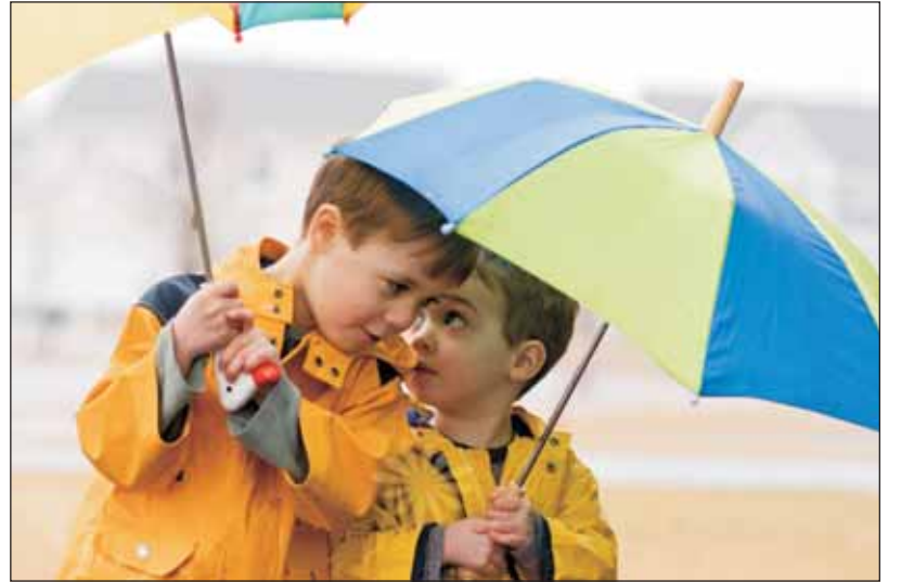
Regen, Wind, Gewitter. Das Wetter bringt immer etwas Neues. Aber wenn wir uns richtig vorbereiten, kann uns auch das schlechteste Wetter nichts anhaben.