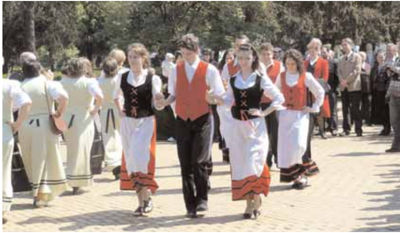
In der Reihe der Veranstaltungen, die anlässlich der Deutschen Kulturtag in Sathmar/Satu Mare vom 23. bis zum 26. April stattfanden, gab es auch einen Trachtenumzug, der Sonntag mittags nach dem Festgottesdienst in der Kalvarienkirche und dem anschließenden Konzert des Jugendchors Maestoso aus Trestenburg bis zum Stadtzentrum führte. Angeleitet wurde der Umzug von den Vereinten Blaskapellen aus Bildegg/Beltiug und Petrifeld/Petrești. Am Trachtenumzug nahmen neben den Trachtengruppen aus Großmaitingen/Moftinu Mare, Sathmar und Trestenburg/Tasnad auch die Teilnehmer des Gottesdienstes teil. Im Park des alten Zentrums konnte man anschließend ein Blasmusikkonzert hören. Die Klänge der Blasmusik lockten beim schönen Wetter viele weitere Zuhörer an. g.r.

SC. Schwab SRL efectuează transport intern și internațional de persoane ocazional cu grupuri organizate cu autocare de 52 și 36 de locuri. Se caracterizează cu calitate și seriozitate! Tel: 0744/702647