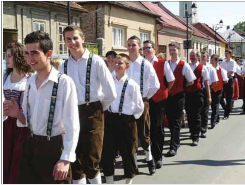
Der Trachtenumzug führte durch das Stadtzentrum

Von der Kirche gingen die Teilnehmer des Festes, angeleitet von den Vereinten Blaskapellen aus Fienen/Foieni, Schamagosch/Ciume o ti und Schinal/Urziceni zum Puppentheater. Im Stadtzentrum zeigten