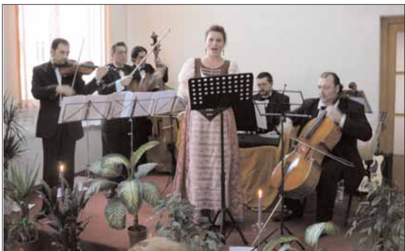
Die bekannten Operetten ernteten Erfolg

Die berühmten Arien von Emmerich Kálmán und Franz Lehár konnte am vergangenen Wochenende das Publikum im Jugendzentrum des DFDR Sathmar im Rahmen eines Operettenabends hören. Das Operettenkonzert, an dem u.a. viele Unternehmer aus dem Kreis Sathmar teilnahmen, bildete den Auftakt der von der Handwerkskammer und dem Deutsch-Rumänischen Wirtschaftsklub in Sathmar organisierten Veranstaltungen im Rahmen