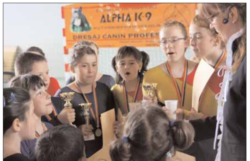
Freude bei den Siegern