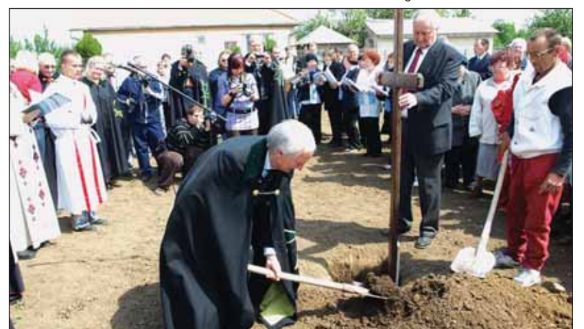
Bei der Grundsteinlegung des Integrationszentrums in Großkarol