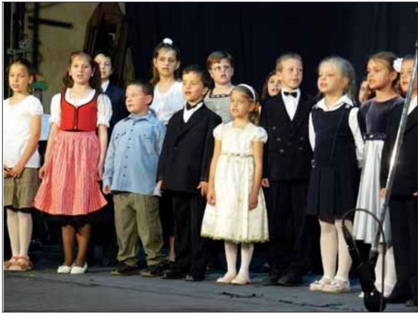
Die Allerkleinsten sangen Frühlingslieder

Jugendliche in schwäbischen und Zipsertrachten sowie Gäste aus ganz Nordsiebenbürgen und ihre Gastgeber bevölkerten am 9. Mai den Hof und die Räumlichkeiten des Deutschen Forums in Neustadt/Baia Mare. Die Gäste aus Sathmar, Oberwischau/Vi o eu de Sus und Großwardein/Oradea kamen in großer Anzahl zum "Frühlingsrauschen", dem alljährlich im Frühjahr veranstalteten kulturellen Treffen der Neustädter.