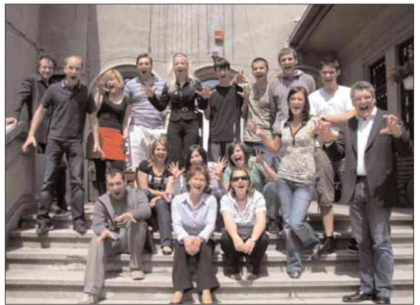
Die Teilnehmer des Radioworkshops hatten viel Spaß

Daraufhin wurde nämlich jeder der Radiojournalisten vor dem Mikrofon beim Einsprechen selbst verfasster Berichte und Moderationen geprüft. Im Vorfeld waren