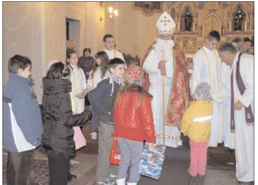
A Mikulástól minden gyerek kapott ajándékot