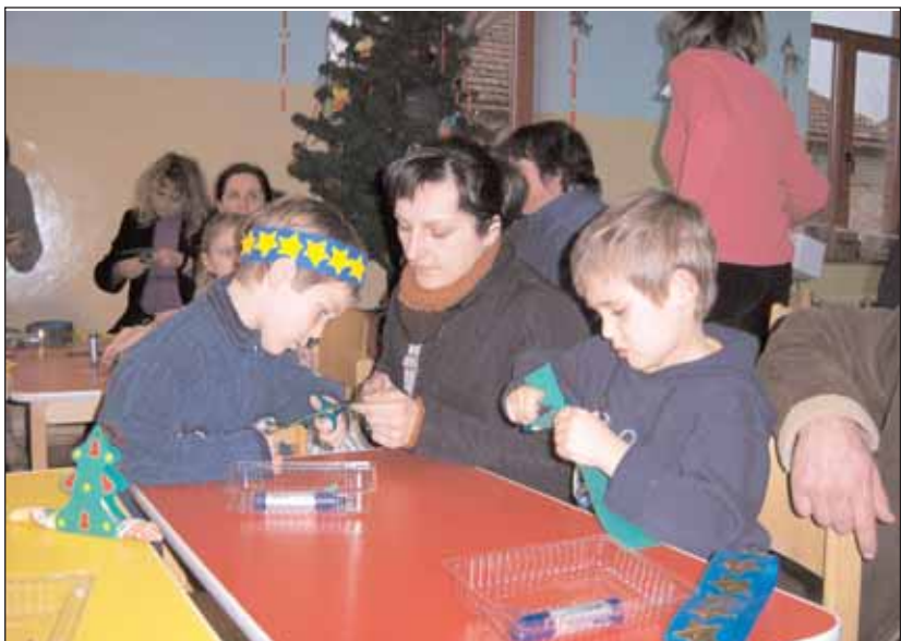
Die Kleinen bastelten mit ihren Eltern