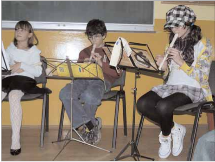
Die jungen Flötenspieler