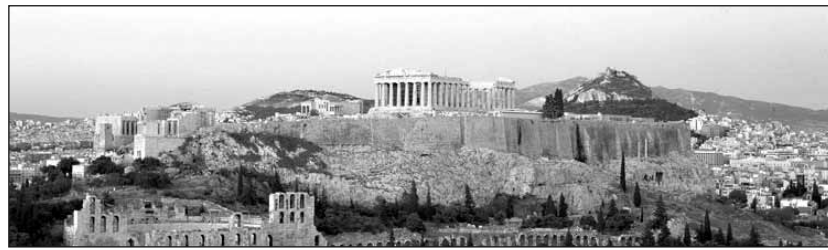
Ein Blick auf die antiken Tempelanlagen auf der Akropolis im Zentrum von Athen, der Hauptstadt Griechenlands.

Lösungen: 1) - a, 2) - c, 3) - c, 4) - b, 5) - c