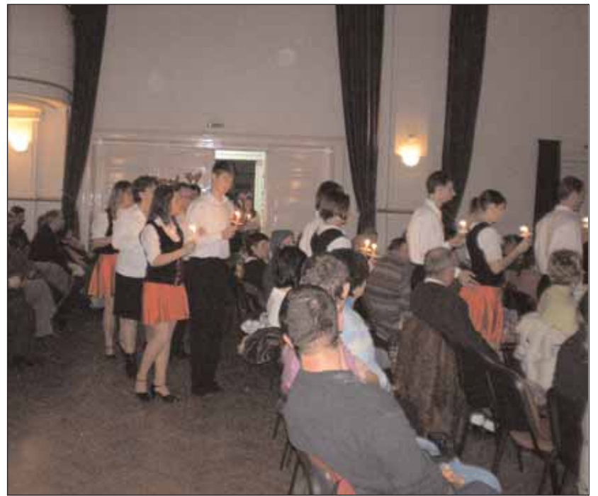
Feierliche Stimmung beim Weihnachtsfest