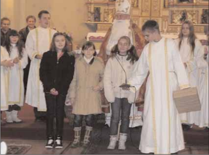
Die Kinder sangen dem Nikolaus

Am 6. Dezember waren alle Plätze in der Kalvarienkirche besetzt, als der Nikolaus nach der Kindermesse die deutsche Gemeinde in Sathmar/Satu Mare besuchte. Der Kinderchor, der auch den Gottesdienst musikalisch mitgestaltet hatte, empfing ihn mit lustigen Nikolausliedern. Auch wagten einige mutige Kindergarten- und Grundschulkinder vor den Nikolaus zu treten und rezitierten ihm Nikolausgedichte oder san-