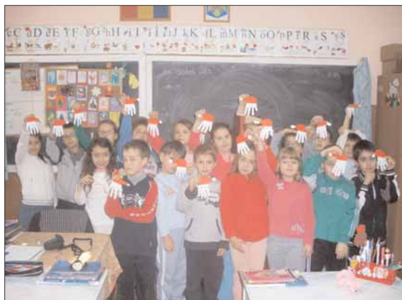
Die Erst- und Zweitklässler aus Zillenmarkt