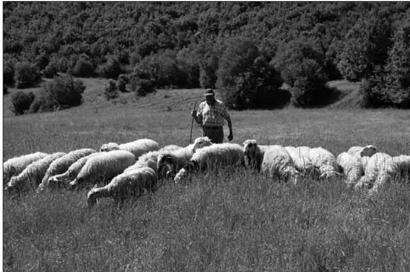
Ein griechischer Hirte zieht mit seiner Schaf-Herde durchs Land.

„Der Junge ist geflohen und hat alle meine Tiere gestohlen“, schrie der Mann, als er im Schnee die vielen Spuren entdeckte. Doch kaum hatte der Mann die Verfolgung aufgenommen, fing es an zu schneien. Es schneite dicke Flocken. Sie deckten die Spuren zu. Dann erhob sich ein Sturm, kroch dem Mann unter die Kleider und biss ihn in die Haut. Bald wusste er nicht mehr, wohin er sich wenden sollte. Der Mann versank immer tiefer im Schnee. „Ich kann nicht mehr!“ stöhnte er und rief um Hilfe. Da legte sich der Sturm. Es hörte auf zu schneien, und der Mann sah einen großen Stern am Himmel. „Was ist das für ein Stern?“ dachte er. Der Stern stand über einem Stall, mitten auf dem Feld. Durch ein kleines Fenster drang das Licht einer Hirtenlampe. Der Mann ging darauf zu. Als er die Tür öffnete, fand er alle, die er gesucht hatte, die Schafe, den Esel, die Kuh, den Ochsen, den kleinen Hund und den Jungen. Sie waren um eine Krippe versammelt. In der Krippe lag ein Kind. Es lächelte ihm entgegen, als ob es ihn erwartet hätte. „Ich bin gerettet“, sagte der Mann und kniete neben dem Jungen vor der Krippe nieder. Am anderen Morgen kehrten der Mann, der Junge, die Schafe, der Esel, die Kuh, der Ochse und auch der kleine Hund wieder nach Hause zurück. Auf der Erde lag Schnee. Es war kalt. „Komm ins Haus“, sagte der Mann zu dem Jungen, „Ich habe Holz genug. Wir wollen die Wärme teilen.“