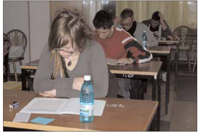
Bei der schriftlichen Prüfung in Sathmar

Am 2. Dezember fand der schriftliche Teil der Deutschen Sprachdiplomprüfung im Johann Ettinger Lyzeum in Sathmar/Satu Mare statt. Insgesamt 48 Schülerinnen und Schüler der zwölften Klassen, davon vier vom Nationalkolleg Kőlcsey Ferenc sowie 16 Schüler des Nationalkollegs "Mihai Eminescu" in Großwardein/Oradea stellten sich der Prüfung, die aus Les- und Hörverstehen sowie aus schriftlicher Kommunikation bestand. Die Arbeiten werden im Frühjahr in Berlin korrigiert. Vorbereitet wurden die Zwölfklässler für die Prüfung während des ganzen Schuljahres ab der elften Klasse.