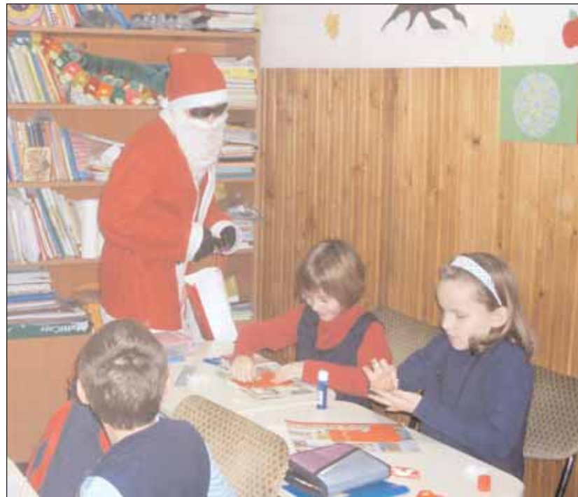
Der Nikolaus verteilt die Geschenke

Die Erst- und Zweitklässler der deutschen Abteilung der Mihai Eminescu Schule in Zillenmarkt wurden auch heuer vom Nikolaus besucht, der wie jedes Jahr mit einem großen Sack voller Geschenke ankam. Die Kinder begrüßten ihn herzlich, sangen ihm das Nikolauslied vor und rezitierten ihm Gedichte. Der liebe Gast erzählte den Kindern die Geschichte des Nikolaus und stellte einem jeden eine Frage auf Deutsch. Nachdem er sich überzeugt hatte, dass die Kinder brav und geschickt sind, teilte er die Überraschungen aus. Alle Kinder versprachen ihm, dass sie auch weiterhin fleißig lernen und die Hausaufgaben nicht vergessen werden. Wir hoffen, ihr werdet euch daran halten - fügen die Lehrerinnen hinzu.