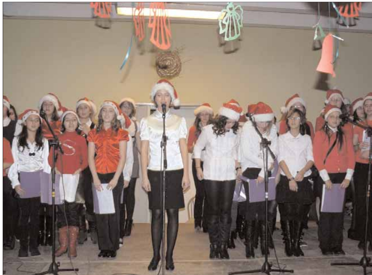
Der Canticum Chor - ein Highlight des Abends

Eine wahrhafte Weihnachtsstimmung empfing die unzähligen Besucher des diesjährigen Weihnachtsbasars am 11. Dezember im Johann Ettinger Lyzeum in Sathmar. Eltern, Lehrer, Gäste und Schüler hatten kaum Platz in der weihnachtlich