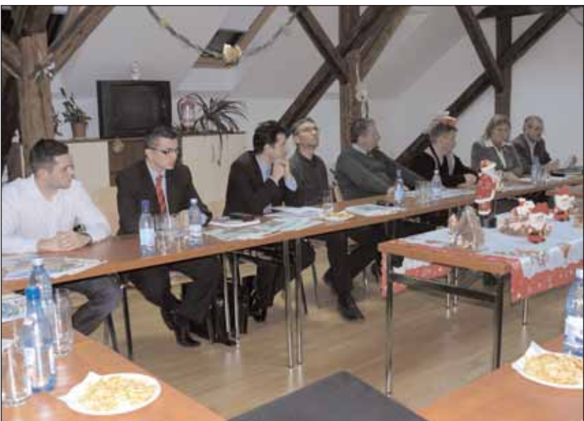
Viele Mitglieder nahmen an der Sitzung teil

Die letzte Sitzung des Deutsch-Rumänischen Wirtschaftsvereins im Jahr 2009 wurde mit einem Weihnachtskonzert des "Dula Duos", Violonisten der Philharmonie Dinu Lipatti aus Sathmar beendet.