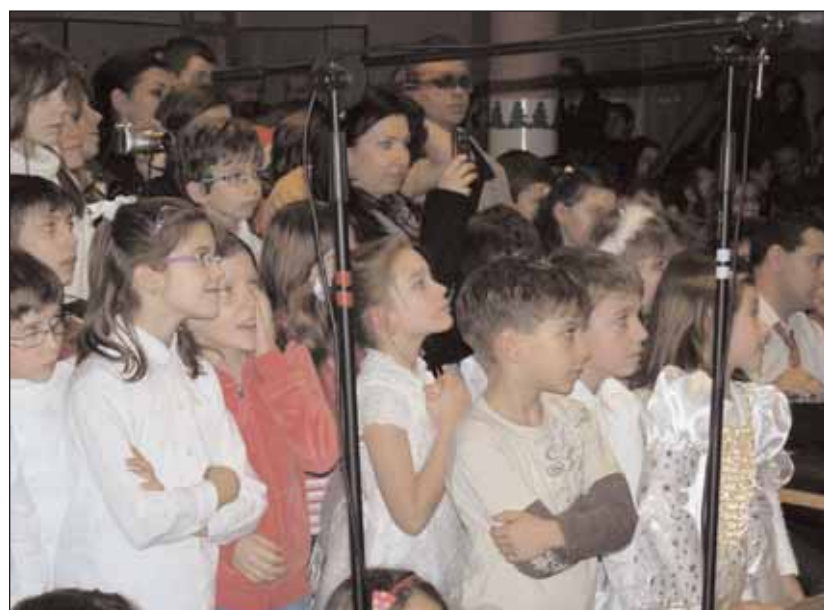
Die Kleinen schauten auch interessiert zu

Zuschauer den Tanz der kleinen Schneeflocken in Darbietung der Erstklässlerinnen sehen. Über den wahren Geist von Weihnachten führten die Viertklässler wie auch die größeren Schüler kurze Theaterstücke auf. Die kleinen Instrumentenspieler des Lyzeums erfreuten das Publikum mit deutschen und rumänischen Weihnachtsmelodien und die Schülerinnen der Klasse 8 B ernteten großen Beifall mit ihrem modernen Tanz. Highlight des Basars waren auch heuer der "Canticum" Chor des Lyzeums und der Chor der Lehrerinnen und Lehrer, der diesmal Weihnachtslieder in rumänischer, ungarischer und deutscher Sprache sang. Die Lieder wurden von den Zuschauern auch mitgesungen. Nach dem kulturellen Programm fand der eigentliche Weihnachtsbasar statt, der vor allem von den kleineren Schülern ungeduldig erwartet wurde. Die Stände wurden auf den Fluren des Lyzeums aufgestellt. Plüschtiere, selbstgemachter Weihnachtsschmuck und Weihnachtskarten, leckere Kuchen und viele andere Waren wechselten im Laufe des Abends ihre Besitzer. Großen Erfolg hatte auch die Tombola, weil jeder dabei etwas gewinnen konnte.