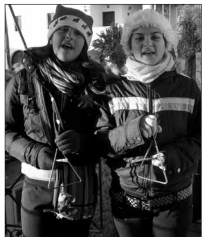
Kalanda - Kinder geben von Haus zu Haus und singen spezielle Weihnachtslieder.

Das Weihnachtsfest startet in Griechenland mit einer Tradition, die den griechischen Kindern besonders viel Freude bereitet: Am 24. Dezember ziehen die Kinder mit Instrumenten, wie Glöckchen, Schellenringen