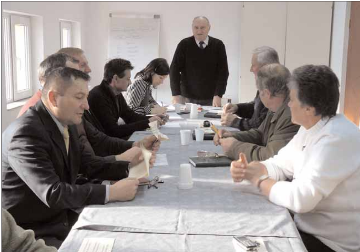
Forumsvorstand zogen Bilanz