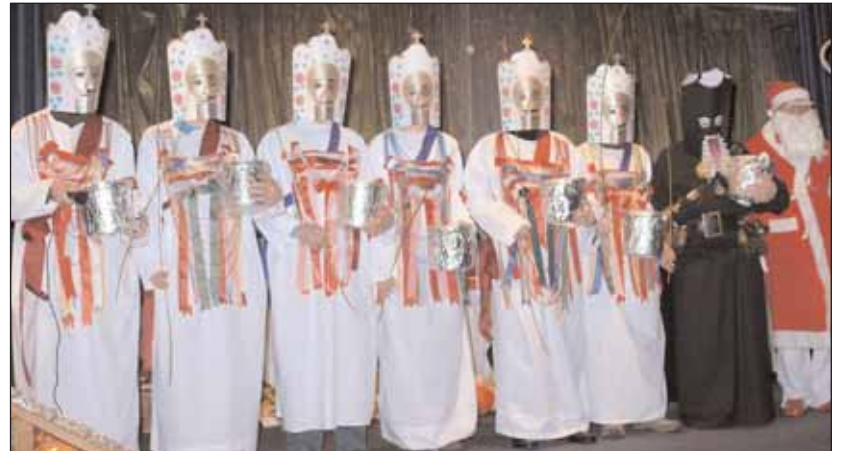
Die "Glase" auf der Bühne