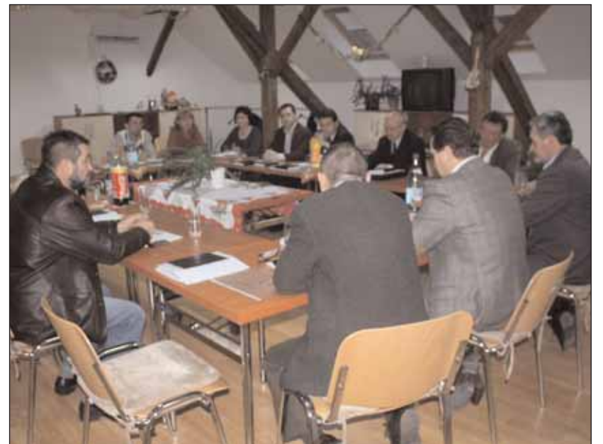
Bei einer Sitzung der Handwerkskammer